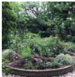
▲こもれびの庭。ヒューケラ、カレックス、コリウスなど寄せ植えに

移動しやすく、スタンド等で高さを変えられるプランターが便利。最近ではみ殻を原料とした環境配慮型のプランターもあります。つる性の植物を植えて日除けにしたり、窓辺の花やシンボルツリー、家庭菜園など、お庭に負けない緑の演出空間になります。