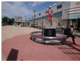
4月に完成した祖師ヶ谷大蔵駅前広場