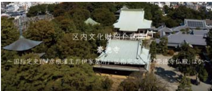
区内文化財紹介動画(豪徳寺)

A 収蔵資料の閲覧に留まらず、観光や学習など様々な視点をもって、歴史や文化財、まち歩き動画などを作成、継続的に公開していく。