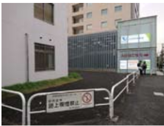
成城学園前駅南口の様子

A 駅前広場の活用は用地買収の途中、また完成後でも地元の要望を聴きながら更なる整備を進める。また利便性だけでなく景観の視点をもって緑の質・量を増やしていく。