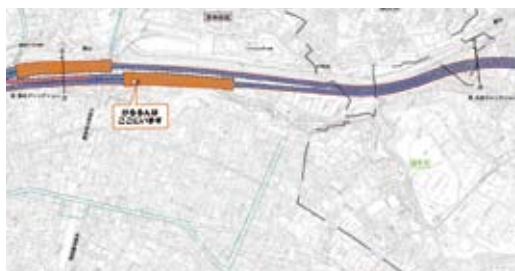
外環トンネル掘進位置(東京外環プロジェクトHPより) 2019.9月現在

A 工事事業者のホームページで日々の掘進位置を表示するほか、PCを使わない方にもわかるよう該当地域の各戸にお知らせ文書を配布しています。家屋への影響など一般的な相談窓口に加え、騒音・振動など異変を感じた時の緊急対応は24時間専用ダイヤルを設け、ご案内しています。